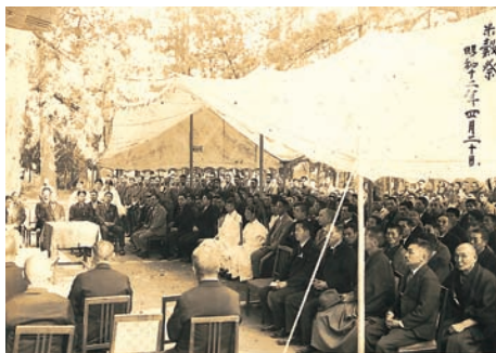
米 穀 祭

高瀬神社では年間約六十の祭典・行事があり、例祭、祈年祭、新嘗祭の三大祭をはじめ、祈年穀祭(特殊神事)など、稲作・農業に深く関わるお祭りが毎年盛大に斎行されます。その稲作に関係する神事の中で、「米穀祭」というお