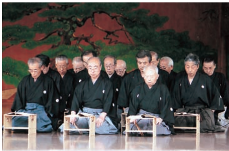
前列左から2人目（本人）

今回の伊勢神宮能舞台出演は、鷹司大宮司にお会いできたことで、大変思い出深いものとなった。